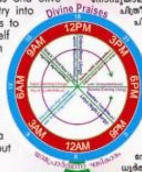
നോമ്പുകാലം : ചിത്ര വ്യാഖ്യാനം

During these weeks the faithful meditate on the public life of Jesus ending in Crucifixion and Burial. The road to the Cross shows this. The flowering and crowned Cross depicts Jesus' victory over sin, death and Satan. Important events on this path are pictured on the sides. Raised hands and olive branches show Jesus' triumphal entry into Jerusalem. The Paschal Lamb points to Jesus' immolation on Gogulta. His self gift to humanity proclaimed in establishing the Holy Qurbana. The serpent around the stones shows Jesus' fasting and temptation. The desert indicates Israel's wandering in the wilderness and the Ark of the Covenant God's consoling presence among them. The basic attitude of a believer during Great Fast is nothing but that of the Prodigal son.