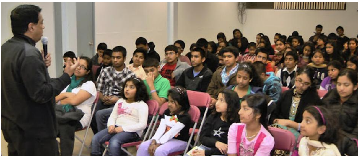
Photo left: Night Vigil for children and youth held at St. Mary's Church.