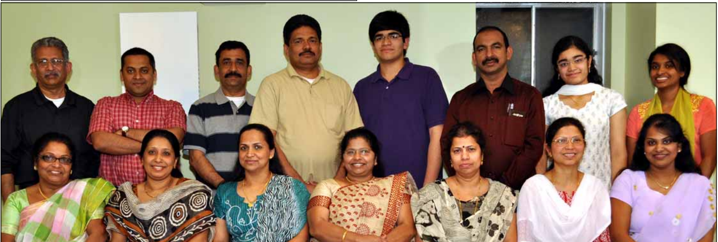
Office bearers and representatives of St. Stephen Koodara Yogam