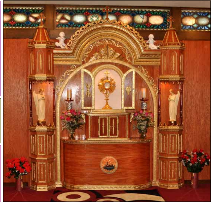
Our newly blessed adoration chapel at St. Mary's Church Morton Grove. Adoration is on Saturdays from 11:00 A.M. to 5:00 P.M. All are welcome.

സീറോമലബാർ പാരമ്പര്യപ്രകാരം മാർച്ച് 4 വെള്ളിയാഴ്ച വൈകുന്നേരം 6:00ന് സെന്റ് മേരീസ് പള്ളിയിലും 7:00ന് സേക്രഡ് ഹാർട്ട് പള്ളിയിലും മരിച്ചവരുടെ പാട്ടുകർബ്ബാനയും ഒപ്പീസും ഉണ്ടായിരിക്കുന്നതാണ്. പരേതരുടെ ഹോട്ടോകൾ കൊണ്ടുവരാവുന്നതാണ്.