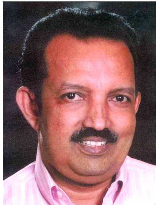
Sunny Vettathukandathil S.H. Mount, Kottayam