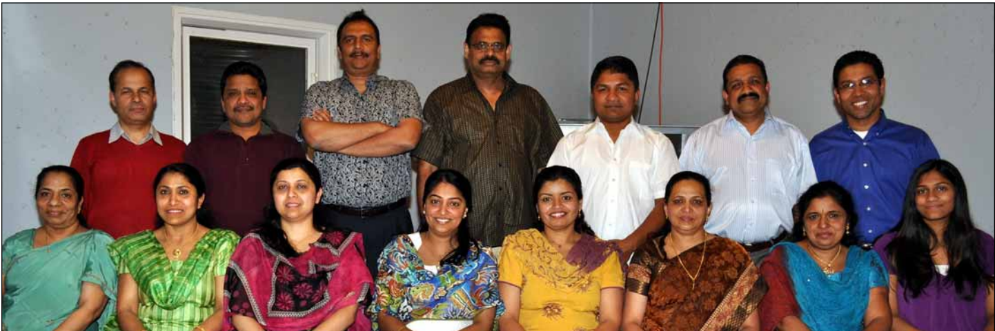
Office bearers and representatives of St. Theresa Koodara Yogam

സെന്റ് മേരീസ് പള്ളിയുടെ ബാങ്ക് ലോൺ ഒഴിവടയ്ക്കുന്നതിനുവേണ്ടി വ്യക്തികളിൽനിന്നു മൂന്നു ശതമാനം പലിശയ്ക്കു വായ്പയെടുക്കുന്ന പദ്ധതിയിൽ സഹകരിക്കുവാൻ ദയവായി കൈക്കാരന്മാരുമായി ബന്ധപ്പെടുക. നിങ്ങളുടെ സഹായം പള്ളിയുടെ പുരോഗതിയെ ത്വരിതപ്പെടുത്തുവാൻ ഏറെ സഹായിക്കും.