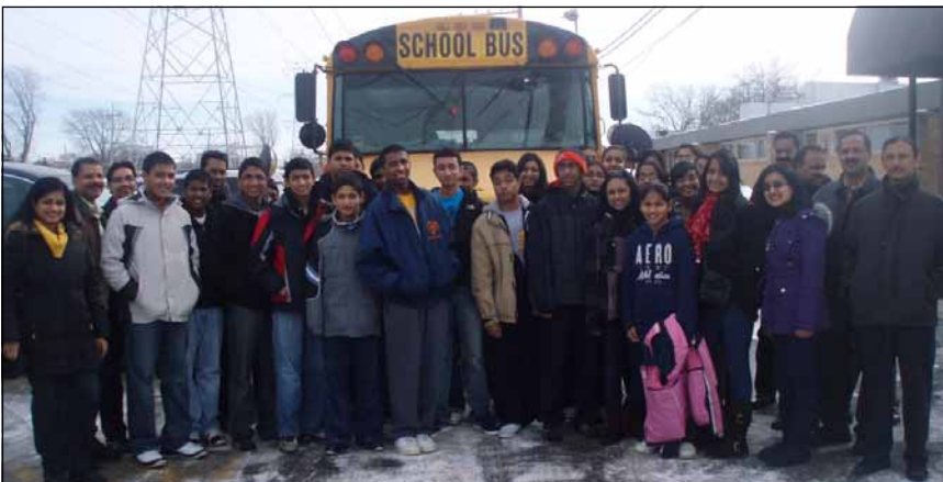
Youth Ministry Team of St. Mary's Parish with their coordinators at the time of departure from Morton Grove Church to the Shelter.

experience and I would like to express my gratitude to the Auntis and Uncles who arranged this activity for us through the Youth Ministry of St. Mary's Knanaya Catholic Parish.