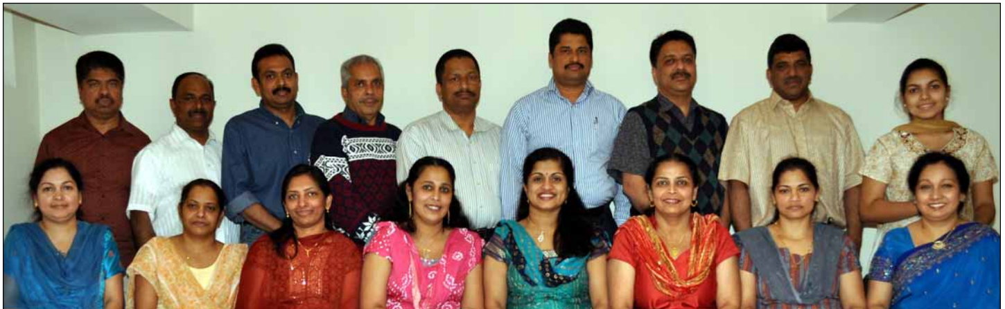
Office bearers and representatives of Lourde Matha Koodara Yogam