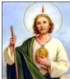
- ഒരു വിശ്വാസി