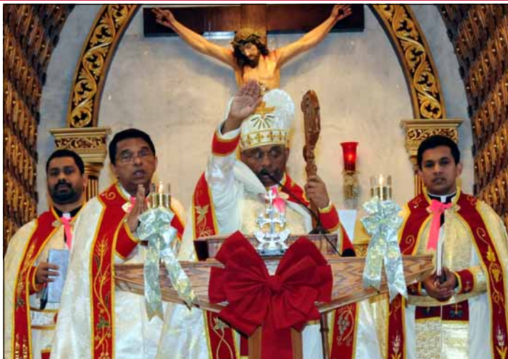
Feast Celebration of St. Stephen at St. Mary's Church.