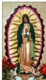
- ഒരു വിശ്വാസി