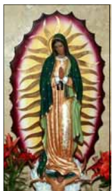
- ഒരു വിശ്വാസി