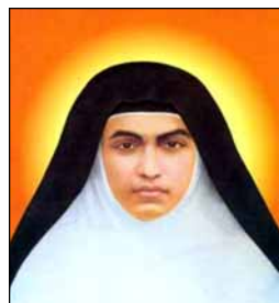
- ഒരു വിശ്വാസി