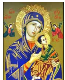
- ഒരു വിശ്വാസി