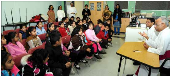
Bishop's meeting with First Communion Candidates.