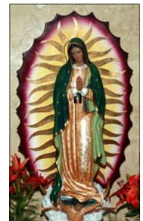
- ജോണി തെക്കേപ്പറമ്പിൽ