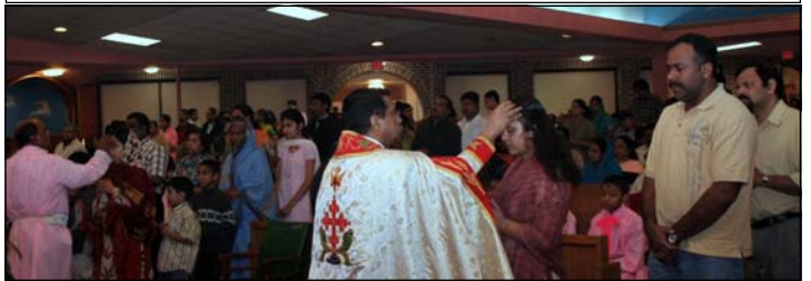
Ash day penitential service at Maywood church.