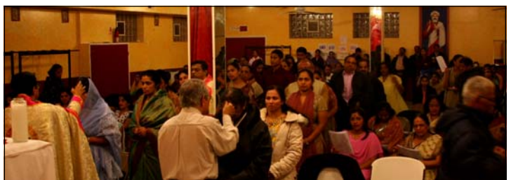
Ash day penitential service at Community Center.