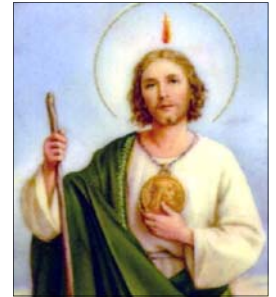
- Kulathilkarottu Family