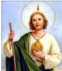
- Kulathilkarottu Family