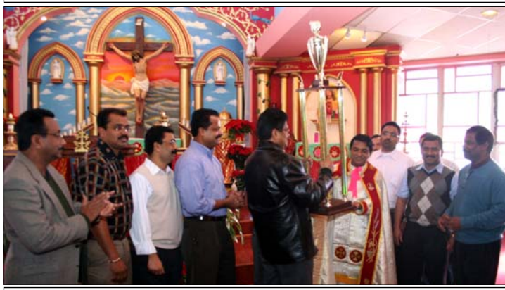
Representatives of St. Stephen's Koodara Yogam receiving trophy for Christmas Carol from the vicar. Photo Below: Alter Servers' training at Maywood.

ലേഖ: ഗലാ 5:1-6 നമ്മെ സ്വാതന്ത്ര്യത്തിലേയ്ക്കു മോചിപ്പിച്ച ഈശോ. സുവി: യോഹ 15:9-17 സ്നേഹത്തിൽ നിലനില്ക്കുക. ജനുവരി 24 ദനഹാ മൂന്നാം ഞായർ പഴ: സംഖ്യ 11:11-20 മൃഗയുടെ പ്രാർത്ഥന സ്വീകരിക്കുന്ന കർത്താവ്. ലേഖ: ഹെബ്രോ 4:1-10 വിശ്വാസത്തെ മുറുകെ പിടിക്കുക. സുവി: യോഹ 1:29-42 ഞങ്ങൾ മിശിഹായെ കണ്ടു.