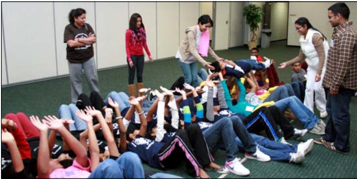
Learning spiritual lessons from games and skit.