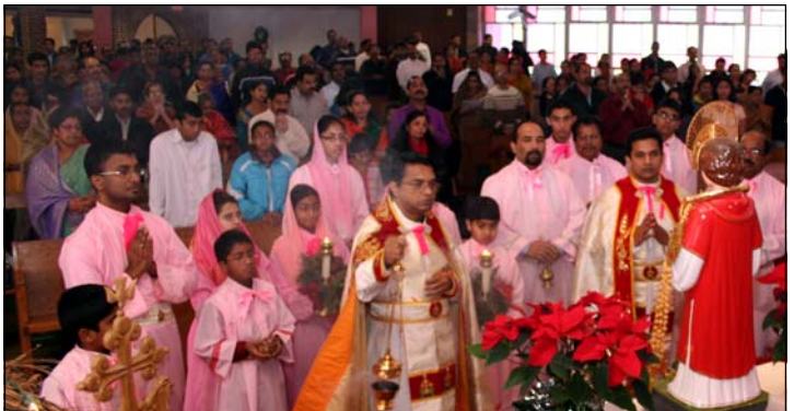
Feast Celebration of St. Stephen at Maywood sponsored by parishioners from Uzhavoor Forane. Photo Below: Sponsors for next year (Kurumulloor parishioners) take charge.

പഴ: സംഖ്യ 10:29-36 വാഗ്ദത്ത നാട്ടിലേയ്ക്കുള്ള യാത്ര. ലേഖ: ഹെബ്രോ. 3:12-19 ദൈവത്തിൽനിന്നും അകലരുത്. സുവി: യോഹ. 1:1-28 യോഹന്നാൻ മാംദാനായുടെ സാക്ഷ്യം.