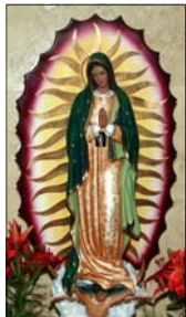
By Mathew Keezhangatt