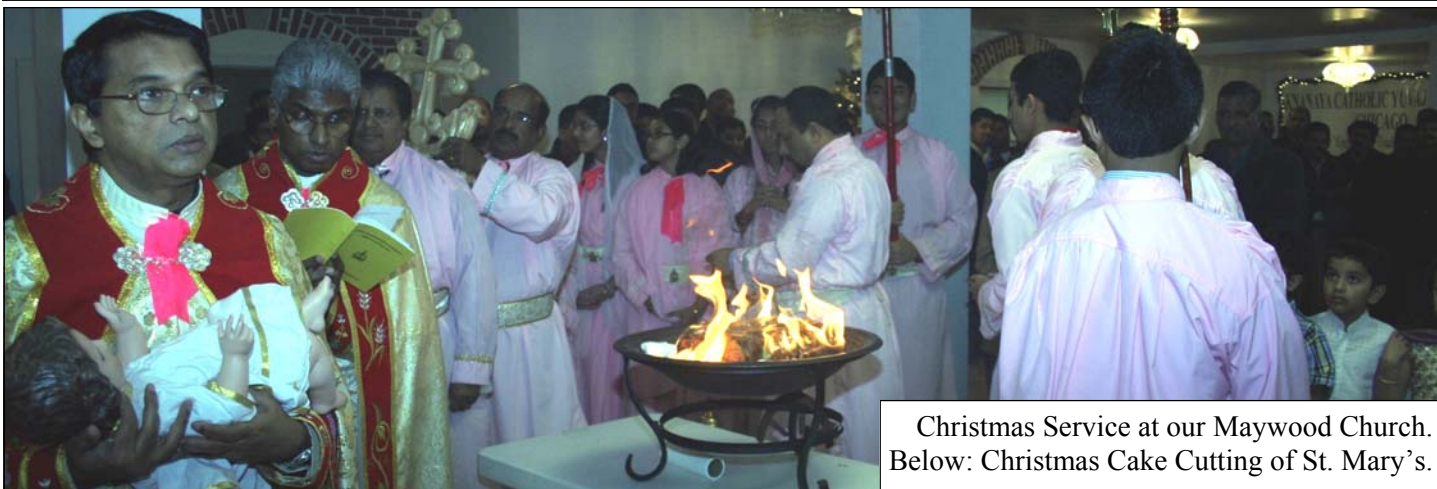
Christmas Service at our Maywood Church. Below: Christmas Cake Cutting of St. Mary's.