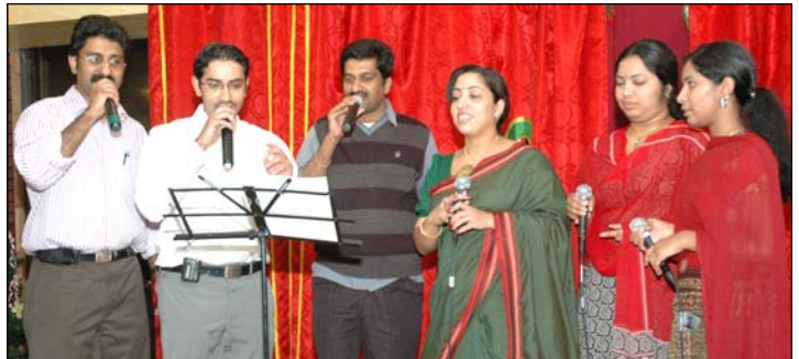
Photos Above: Christmas celebrations of St. Mary's Unit. Photo Below: St. Mary's Women Ministry Carol Team visiting homes with Carol songs.