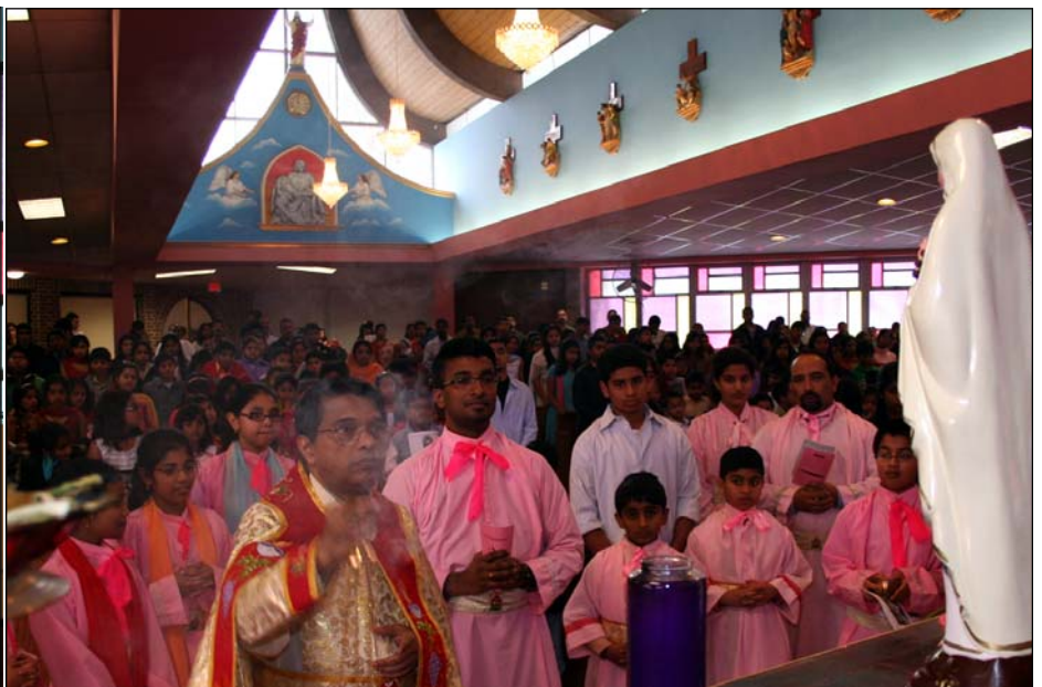
Photo Above: Feast Celebration of Our Lady of Guadalupe at Maywood. Photo Left: Statue of the Most Sacred Heart of Jesus from Kerala to be installed at Maywood Church.