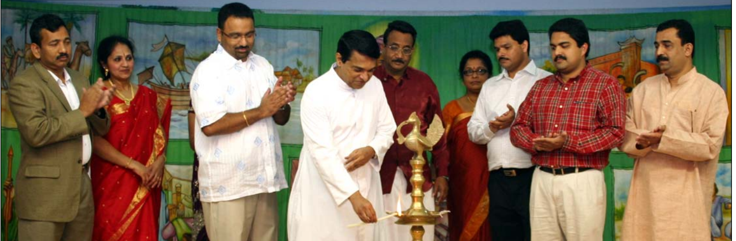
Photo above: Inauguration of the anniversary of Koodarayaogams, men's ministry, and women's ministry at Maywood.