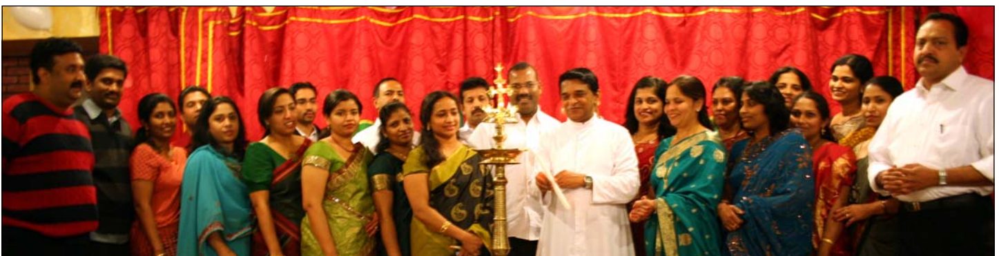
Photo below: Inauguration of Christmas celebration of Women Ministry of St. Mary's Unit at Community Center.