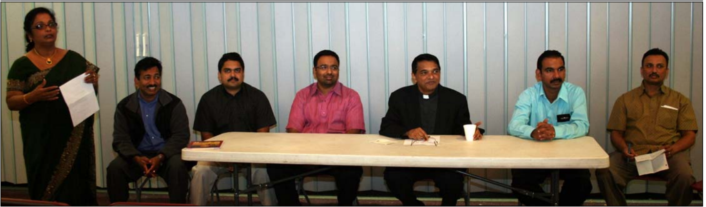
Photos of Pothuyogam held at Maywood church.