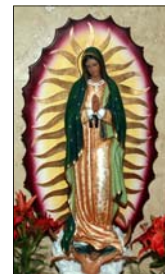
- Jiji Poothakkari