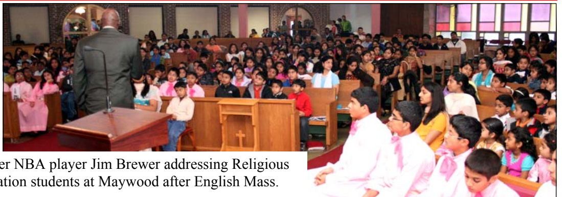
Former NBA player Jim Brewer addressing Religious Education students at Maywood after English Mass.