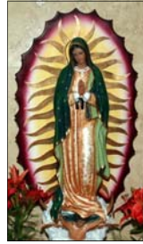
- Chinny Malikal