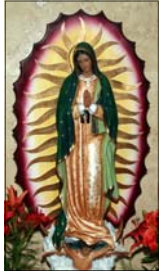
- Chinny Malikal