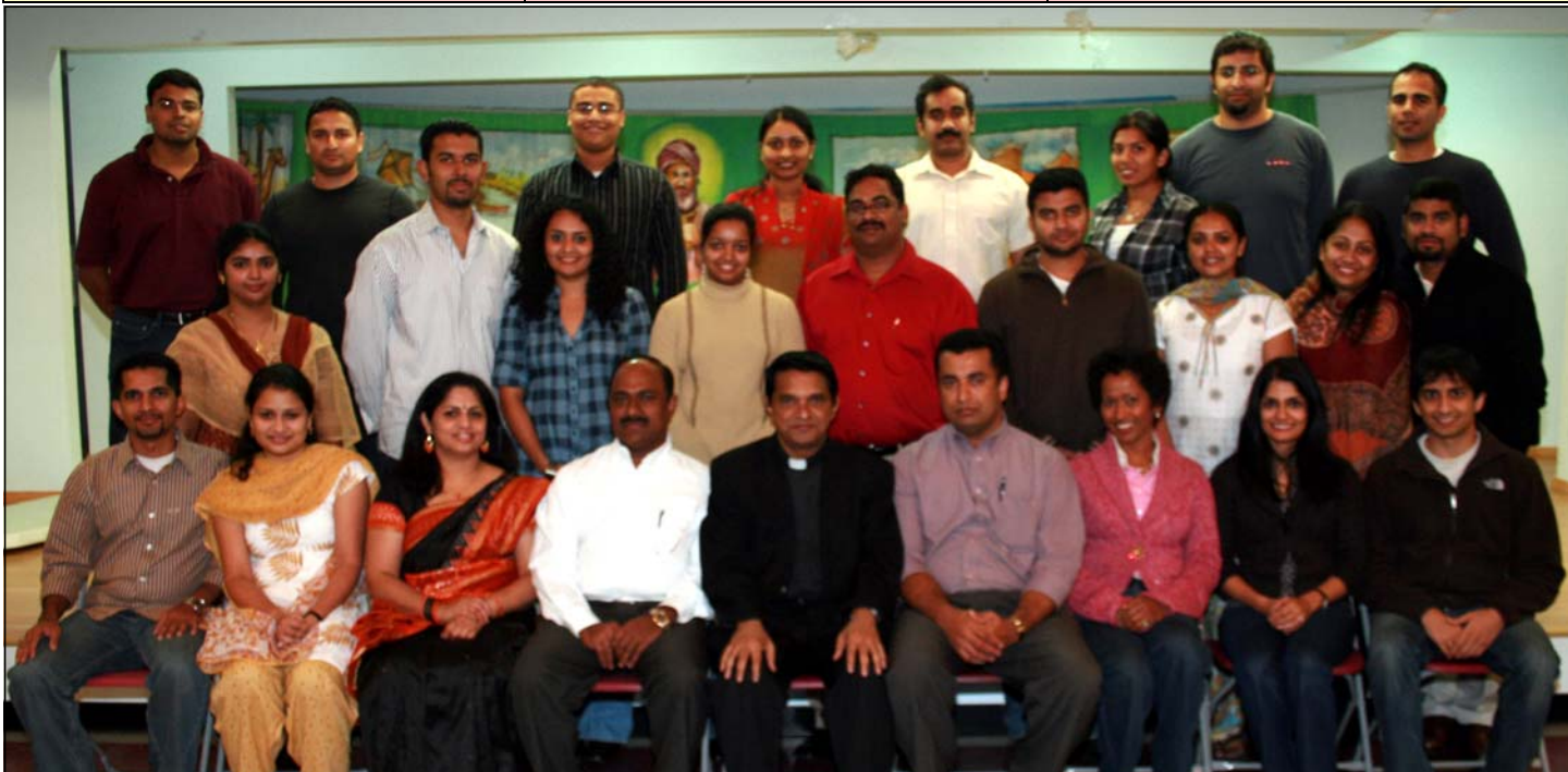
Organizers and participants of Marriage Preparation Course held at our church by Family Commission.