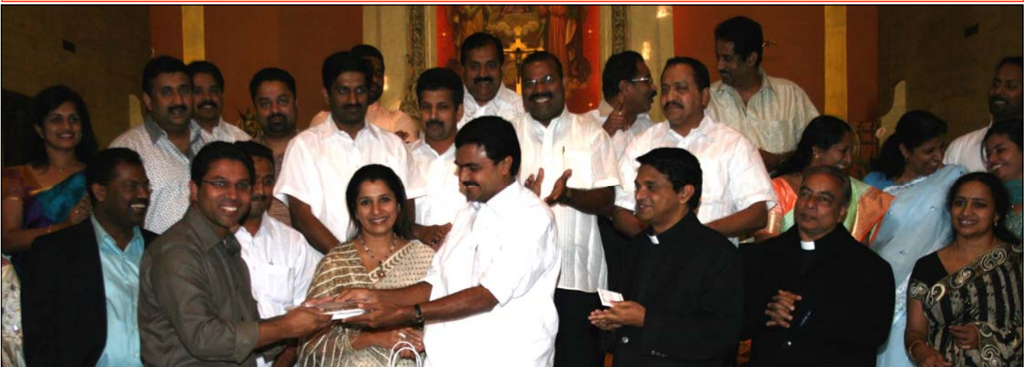
Photo above: Jose K. Mani M.P. inaugurating the fund raising programs of women volunteers of St. Mary's Unit at OLV Church.

നാം ഉദ്ദേശിച്ചതിലും നേരത്തെ ഡൗൺ പേയ്മെന്റിനു വേണ്ട തുകയും ബാങ്ക് ലോണം ദീർഘകാല പാർക്കിംഗ് പെർമിറ്റും ലഭ്യമായതിനാൽ മോർട്ടൻ ഗ്രോവിലെ സെന്റ് മേരീസ് പള്ളിയ്ക്കുവേണ്ടിയുള്ള കെട്ടിടത്തിന്റെ ക്ലോസിംഗ് ഈ മാസത്തിൽതന്നെ നടത്തുന്നതാണ്. ഈ പദ്ധതിയ്ക്കുവേണ്ടി അദ്ധ്വാനിക്കുകയും സഹകരിക്കുകയും ചെയ്യുന്ന ഏവർക്കും അനുമോദനവും നന്ദിയും അർപ്പിക്കുന്നു.