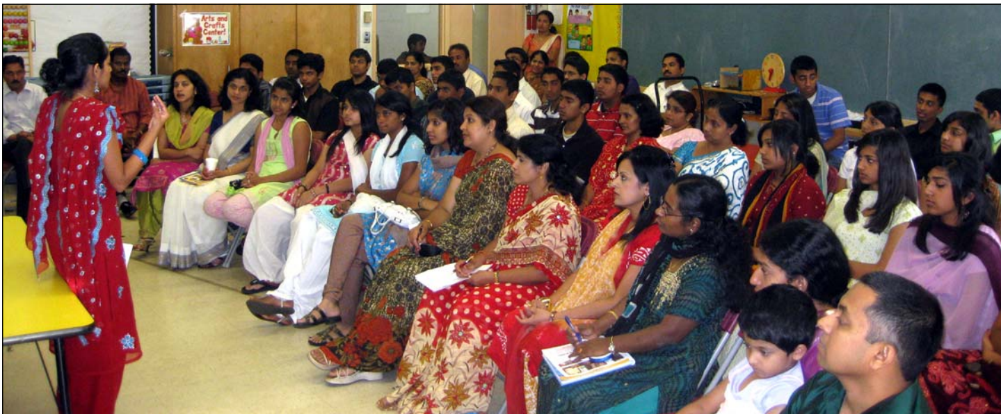
Religious Education Teachers' Training held at our parish church for Sacred Heart School.