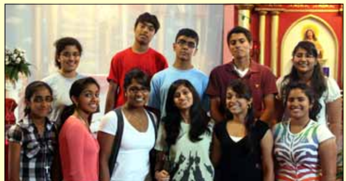
The leaders of Youth Group Adoration on the First Saturdays of every month.

As per the decision made after the last retreat for youth in our parish, we will have Youth Prayer Group with the Adoration of the Most Blessed Sacrament of Jesus on the first and third Saturdays of every month for one hour at our parish church in Maywood after 10:00 A.M. Mass. The first Youth Group Adoration will be on September 5, 2009. All are invited to take part in this great experience of God.