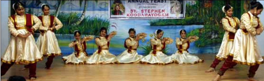
Photo Feature of the feast will continue in the next issue.