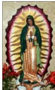
- ഒരു വിശ്വാസി