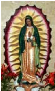
- സാലി ഐക്കരപ്പറമ്പിൽ