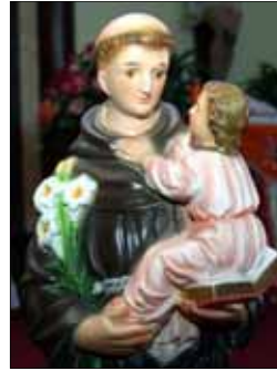
- Suja & Cyril Kattapuram