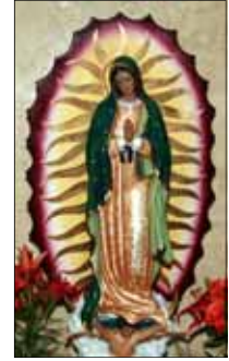
- Suja & Cyril Kattapuram