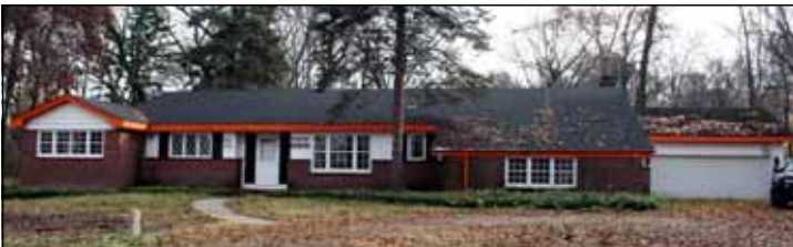
Proposed rectory and temporary Religious Education School.