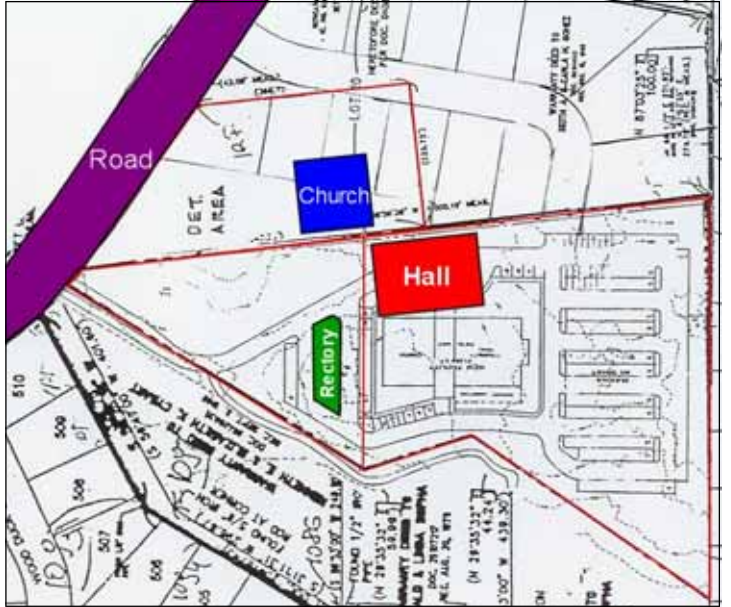
Sketch left: Site plan of the proposed land for St. Mary's Church. Sketch above: Proposed site plan for church, Community Center and Rectory. Photo below: Church Pothuyogam discussing on the purchase of the land