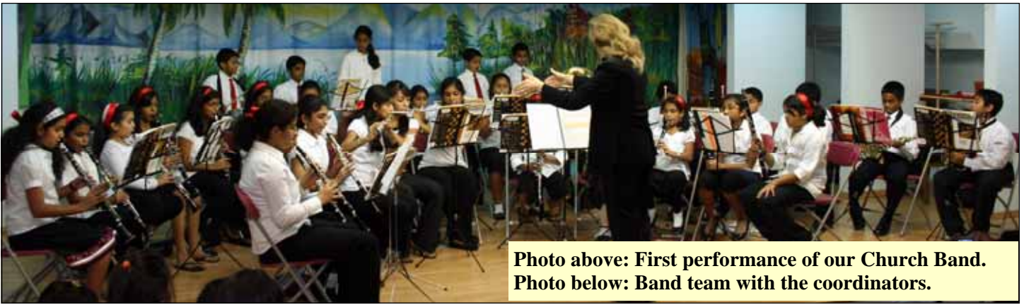
Photo above: First performance of our Church Band. Photo below: Band team with the coordinators.