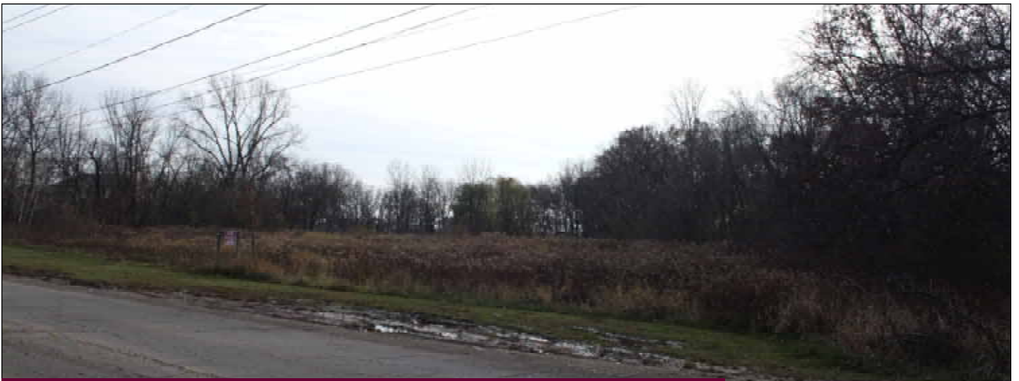
Proposed roadside land for St. Mary's Church to be purchased. KCS land is at the right.

All issues of our bulletin are available at www.knanayaregion.us/chicago/bulletin.htm