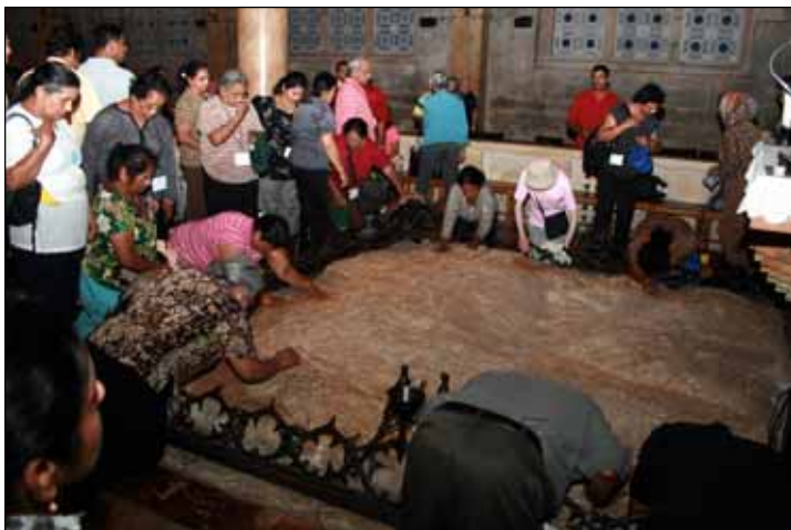
Veneration of two holy stones: Above is the stone that Jesus used to pray at the Garden of Gethsemane before his arrest. Below is the stone used to prepare the body of Jesus before his funeral