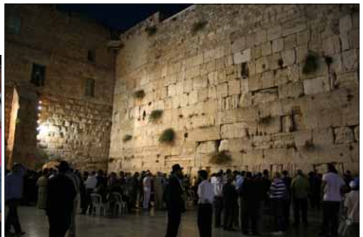
Photo below: Wailing Wall in Jerusalem where Jews lament even today at the loss of their Holy Temple.