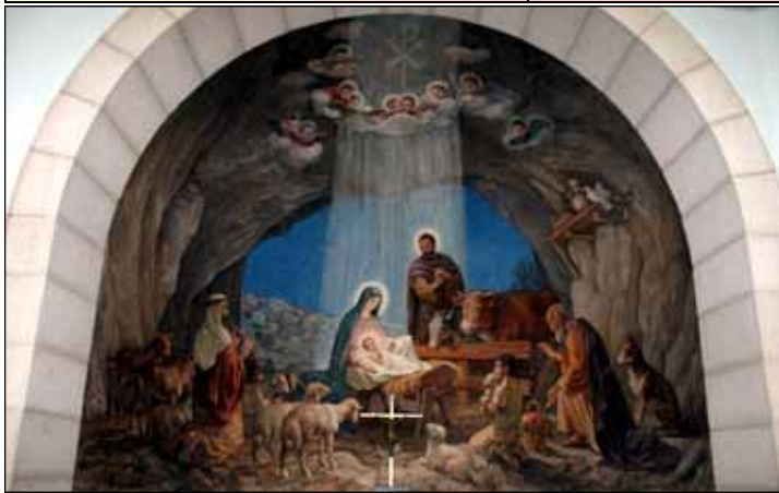
Painting of Nativity in Bethlehem.