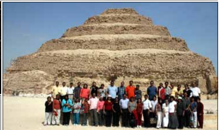
Photos above: Canonization of St. Alphonsa. Prayer at the tomb of Pope St. Pius X. Photo Right: At the oldest pyramid. Photo below: at the world renowned three pyramids.