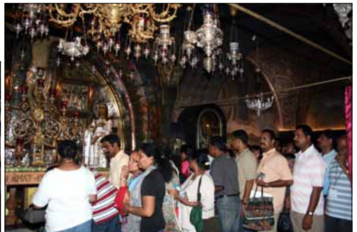
Pilgrims waiting in line to venerate the spot where Jesus was crucified at Calvary.