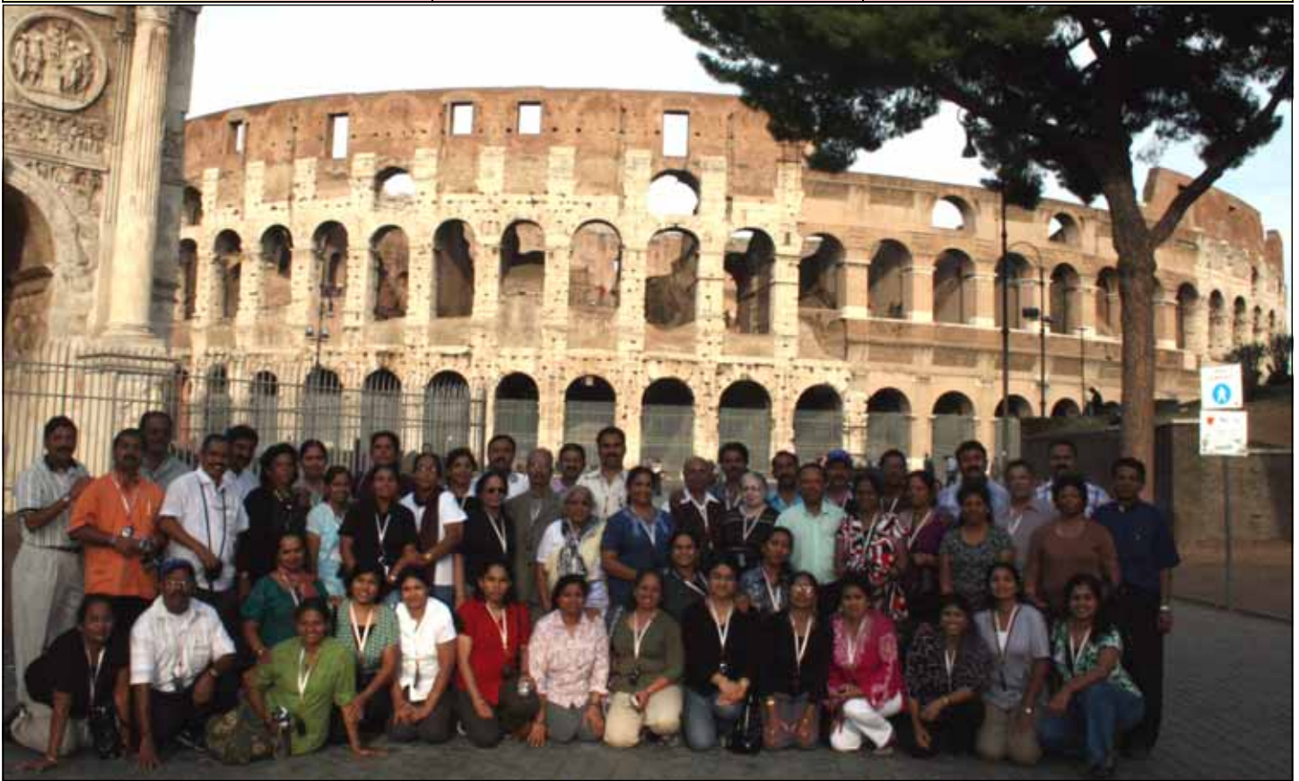
Some of the pilgrims at the famous Coliseum in Rome.