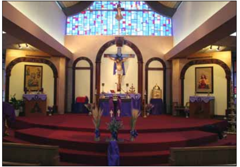
Photos above: Sanctuary when we bought the church. Our first modified Sanctuary. Photo below: Our present sanctuary.