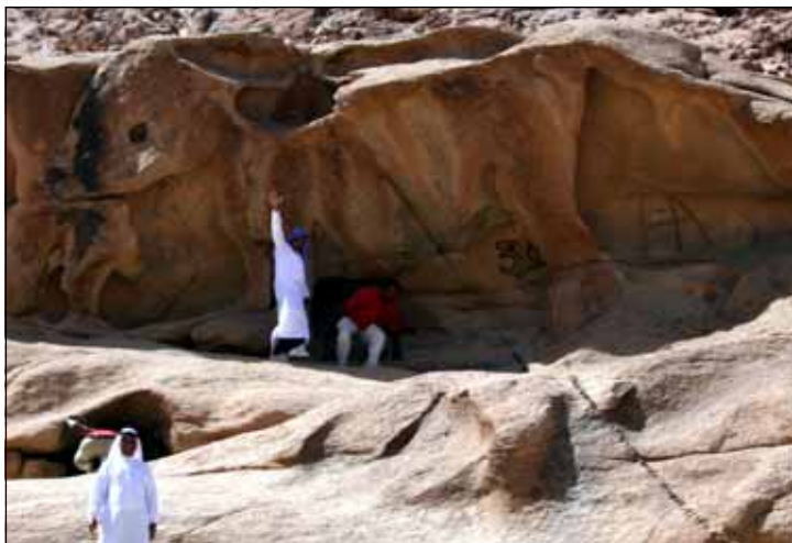
Photos above: Armed police security to assure our protection in Egypt. Image engraved near Mount Sinai of calf used by the Israelites for idolatry while Moses on the mountain receiving ten commandments. Photo below: Stations of the Cross at the real place where it happened.