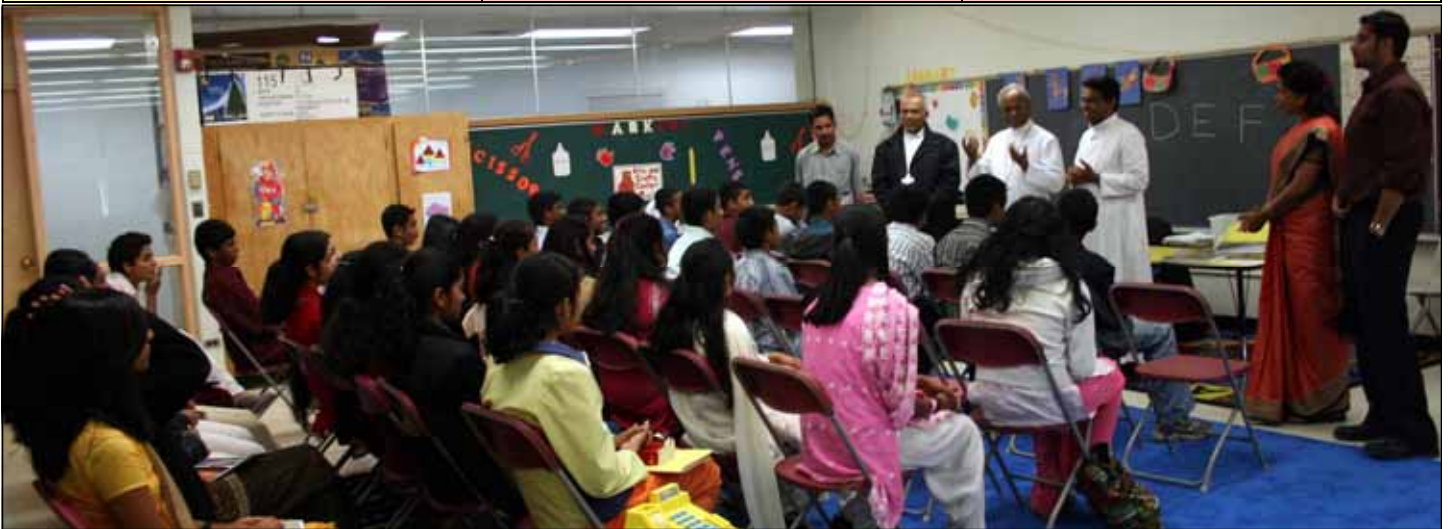
Photo Above: Bishops visiting our Religious Education Classes. Photos below: Bake Sale by Children Ministry for Orissa Mission. Church Choir.