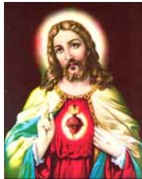
- തോമസ് & മേരി ആലുങ്കൽ