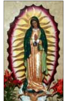
- ഒരു വിശ്വാസി