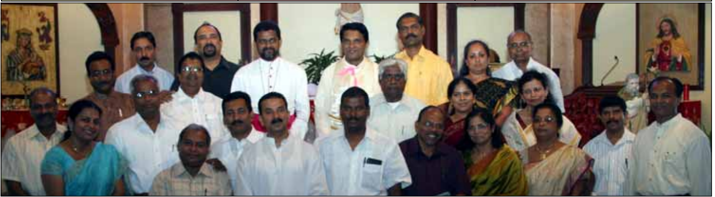
Photo Above: Parish Council Members with Bishop Mar Joseph Pandarasseril. Photo Below: Volunteers of St. Mary's Unit with Bishop Mar Joseph Pandarasseril.