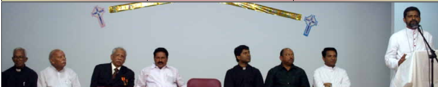
(Continued from page 1)

എല്ലാ പ്രദേശങ്ങളിലേയ്ക്കും മിഷനുകളിലൂടെ വ്യാപിപ്പിക്കുകയായിരിക്കണം കുറേ വർഷങ്ങളിലേയ്ക്കുള്ള നമ്മുടെ പ്രവർത്തന ലക്ഷ്യം. അതൊരു പാസ്റ്ററൽ പ്ലാനായി നമ്മൾ മുന്നോട്ടു കൊണ്ടു പോകണം.