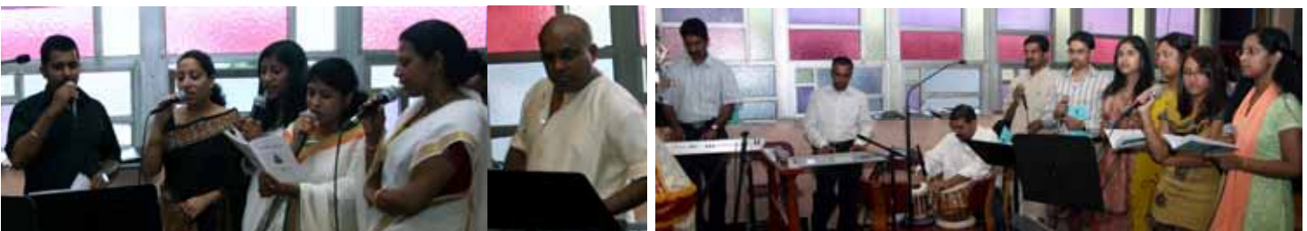
Photos of Kala-sandhya will be available in the next issue.