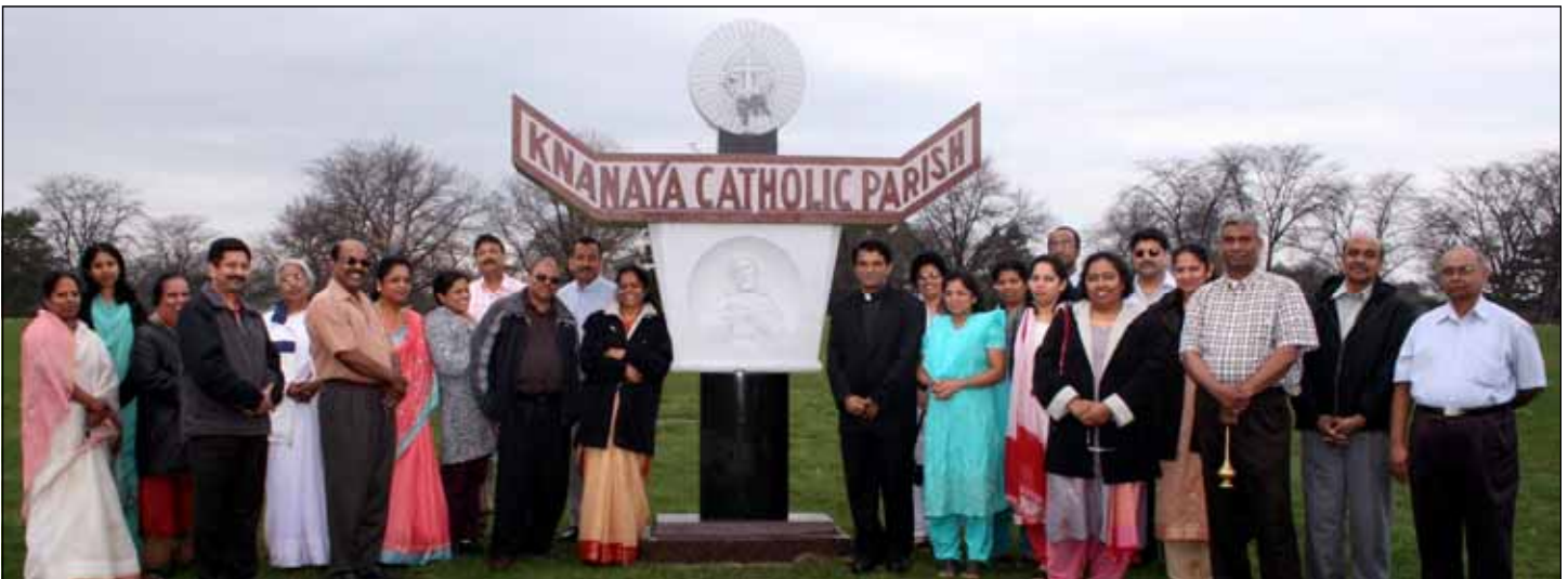
Viewing the shrine at Knanaya Catholic Cemetery in Chicago on Saturday April 19th.