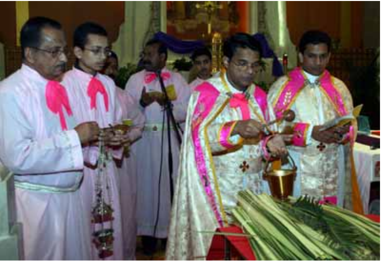
Blessing of palm leaves at Sacred Heart Parish Church and OLV Church for St. Mary's Unit.