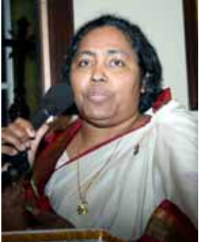
റോസമ്മ സണ്ണി ആക്കാത്തറ ഊസ്റ്റർ ശുശ്രൂഷയ്ക്കുശേഷം പങ്കുവെച്ച അനുഭവ സാക്ഷ്യം.