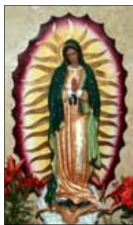
- ഫാ. ഏബ്രഹാം മുത്തോലത്ത്