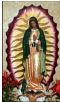
- ഒരു വിശ്വാസി