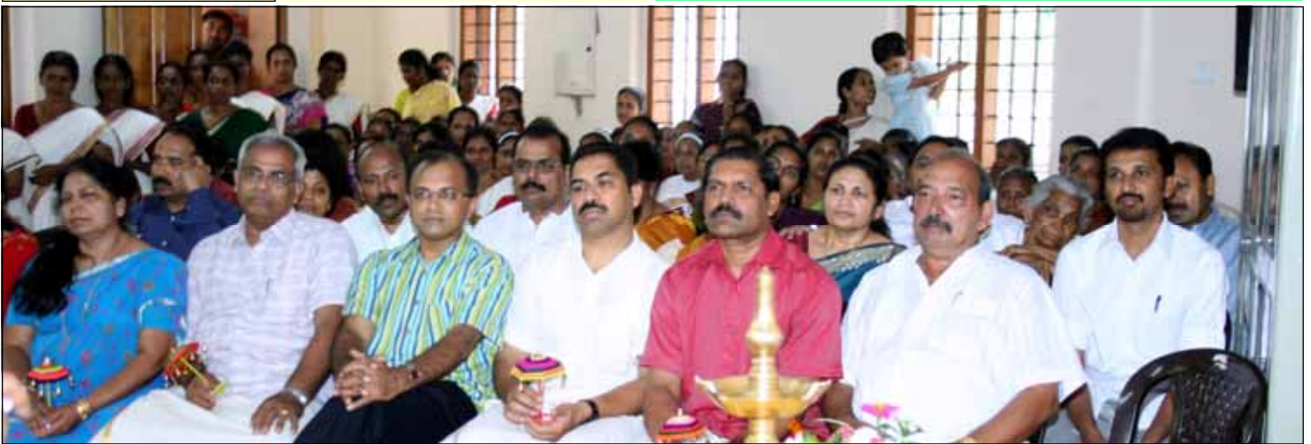
Representatives from our parish at the second anniversary of Agape Bhavan at Cherpunkal.