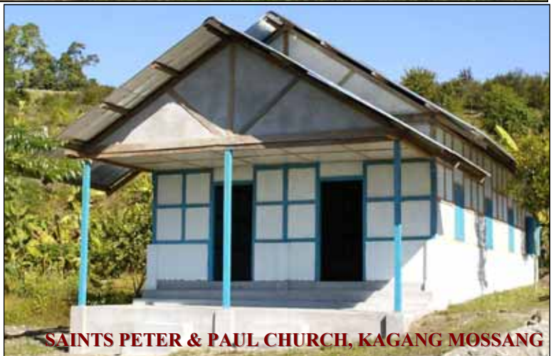
SAINTS PETER & PAUL CHURCH, KAGANG MOSSANG