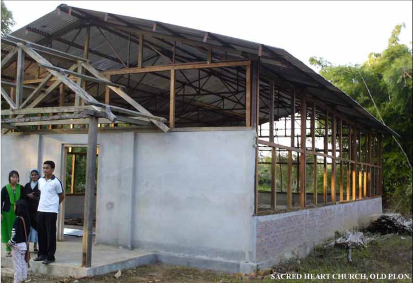
SACRED HEART CHURCH, OLD PLON.