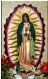
- ഒരു വിശ്വാസി