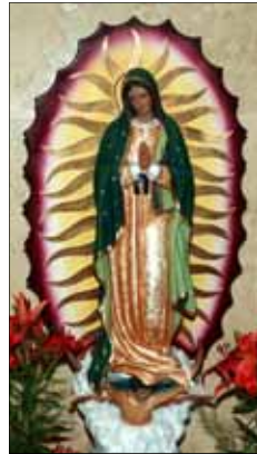
- ഒരു വിശ്വാസി