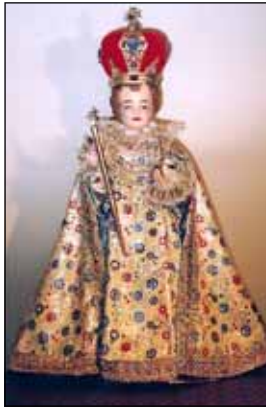
- ഒരു വിശ്വാസി