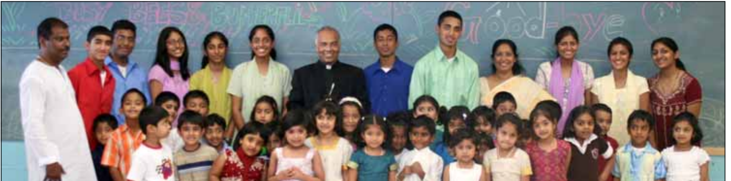
Photo Below: Participants of Memorial Service at Community Center on November 1st.