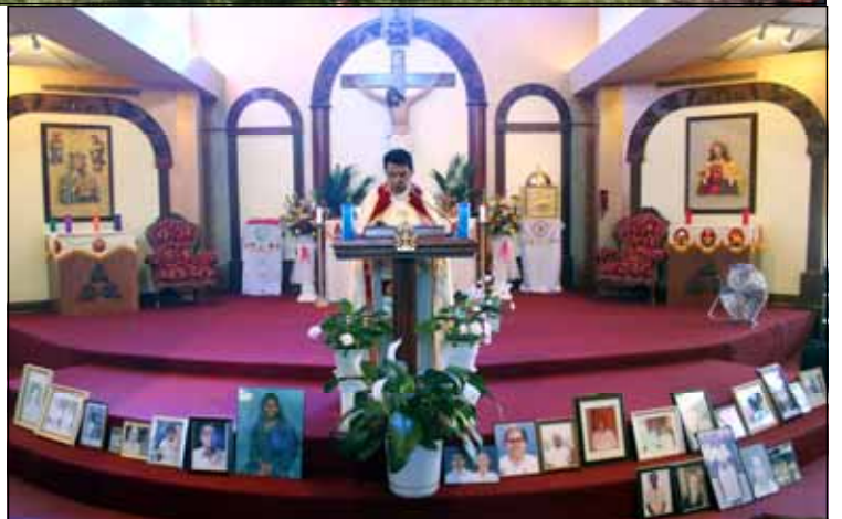
Photos: Memorial Services held at Knanaya Catholic Cemetery, Community Center and our parish church.