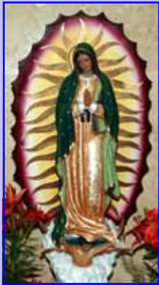
- ലിസ്റ്റി നടവീട്ടിൽ