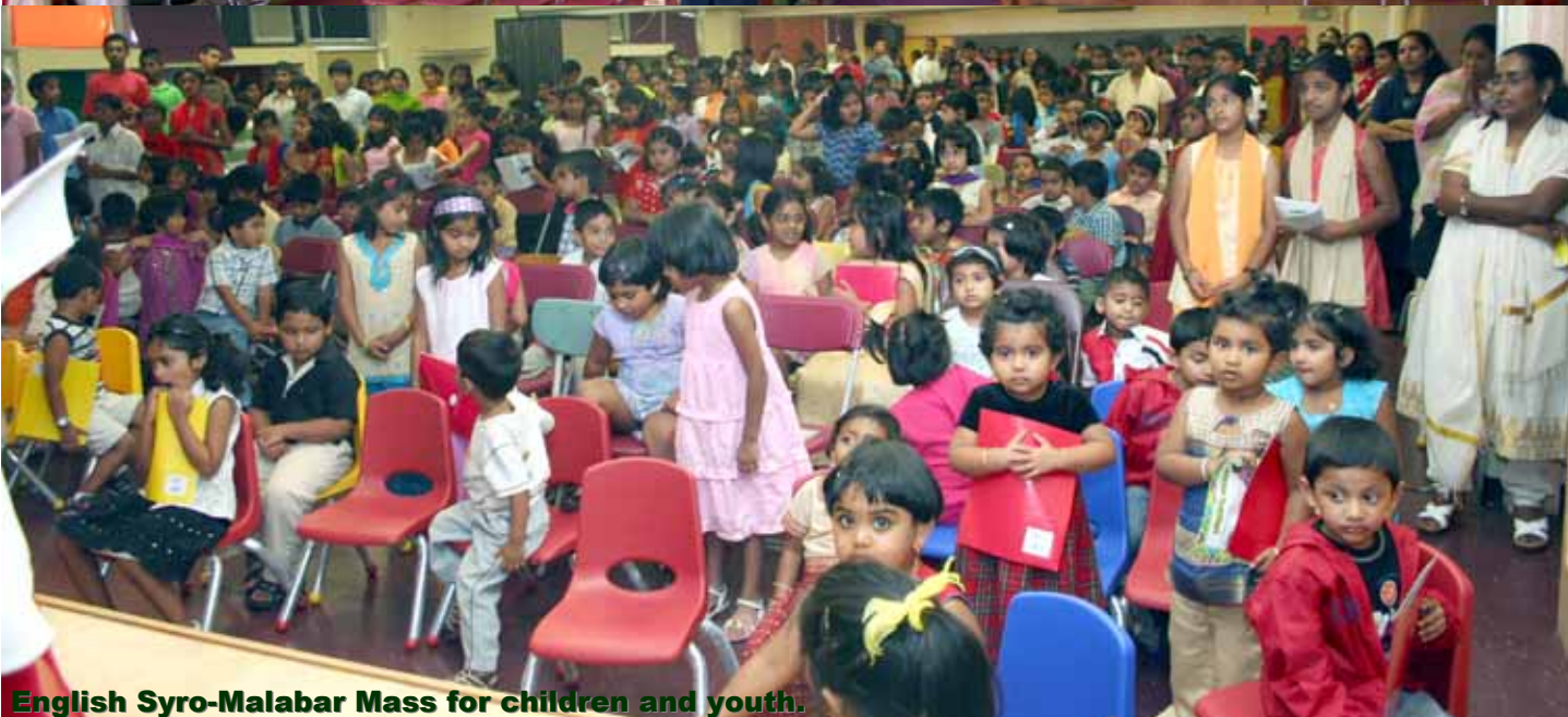
English Syro-Malabar Mass for children and youth.