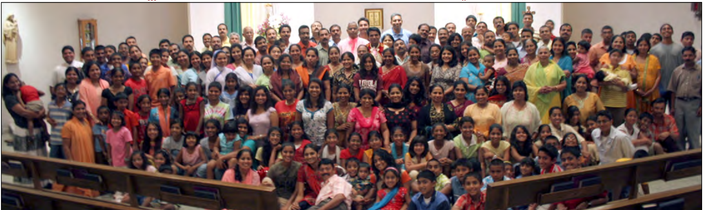
ക്ലാനായ പള്ളി വാങ്ങിയതിന്റെ വാർഷിക ദിനത്തിൽ അർപ്പിച്ച കൃതജ്ഞതാബലിയ്ക്കുശേഷം.. വാർഷിക ക്യാമ്പിൽനിന്നുള്ള വിവിധ ദൃശ്യങ്ങൾ താഴെ.