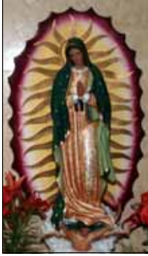
By Annamma Thekkepparambil