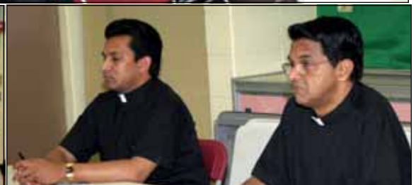
Photos Above: Coordination meeting of various parish committees held at parish hall on August 3rd.