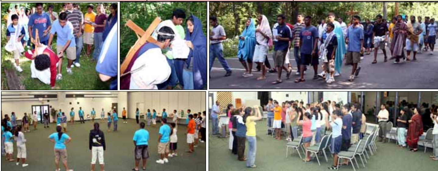
SCENES FROM YOUTH RETREAT HELD IN ROCKFORD FOR YOUR YOUTH