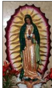
By Vimala Nedumakkal