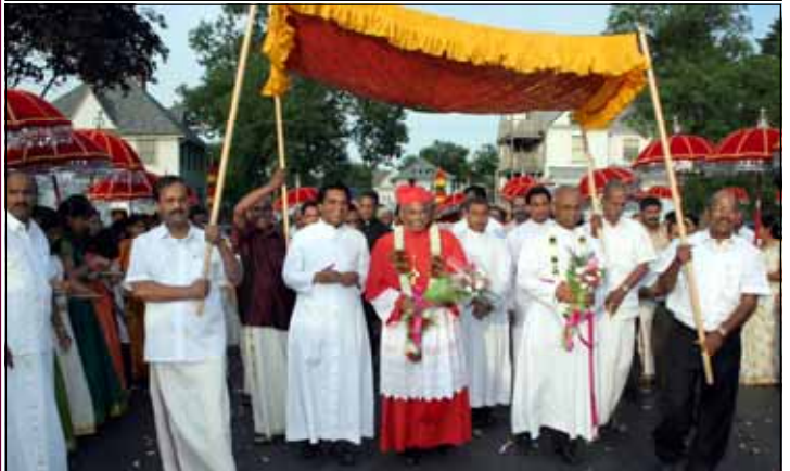
Solemn Reception given to Major Archbishop Mar Varkey Cardinal Vithayathil at our Sacred Heart Knanaya Catholic Church on July 2, 2007