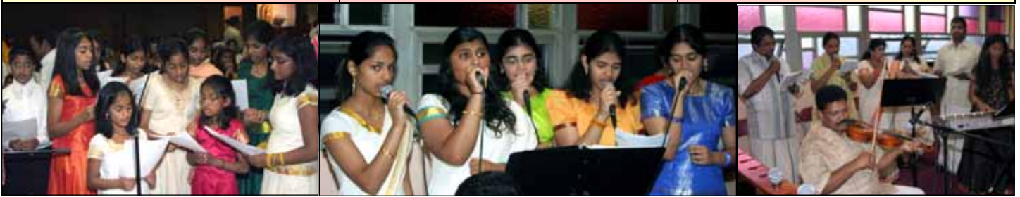
The choir that lead us during the Holy Mass by Mar Varkey Cardinal Vithayathil and Mar Jacob Angadiath