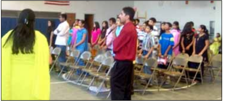
Photo above: Teens Ministry program held at OLV Gym by Jesus Youth Team of Chicago. Photo below: Children Ministry Program held at OLV School Hall by Jesus Youth Team of Chicago.

ഒത്തിരി സ്നേഹത്തോടെ, ഫാ. ഏബ്രഹാം മുത്തോലത്ത്