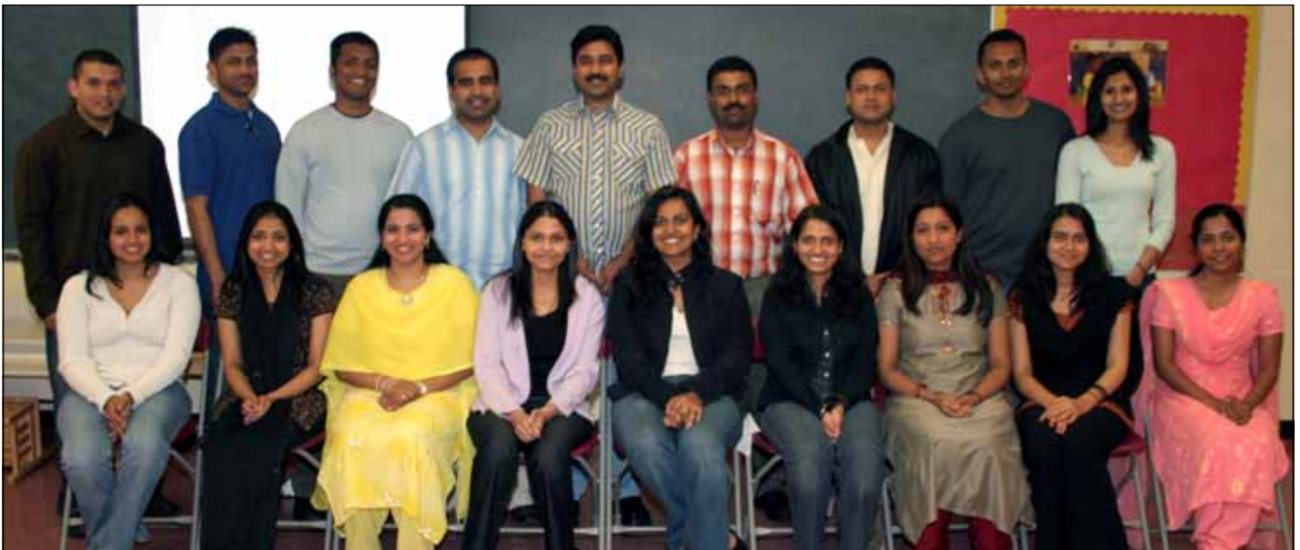
Participants of Marriage Preparation Course held at our parish hall organized by the Family Commission of our parish.

Sacred Heart Church, my second home, is a place of adoration, thanksgiving, learning, friendship, sharing, and love. There is no other place like Sacred Heart Knanaya Catholic Church in this world!