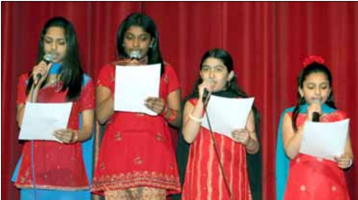
PHOTOS. Left top to Bottom: 1. Preparations for the event. 2. Prize distribution of raffle ticket. 3. Prayer song. Right top to bottom: 4. Snack by Women Ministry. 5. A scene from the drama. Bottom: Women ministry leaders addressing the audience.