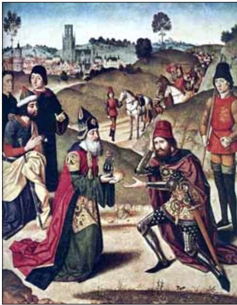
യുദ്ധം ജയിച്ചു വന്ന അബ്രാഹാമിനെ അപ്പവും വീഞ്ഞുമായി വന്ന സ്വീകരിച്ച ജറുസലേം രാജാവും പുരോഹിതനുമായ മെൽക്കിസദേക്ക്.

ദൈവിക നിയമ പ്രകാരം വരുമാനത്തിന്റെ 10% സഭാ കാര്യങ്ങൾക്കു കൊടുക്കണമെങ്കിലും നമ്മിൽ മിക്കവരും മിനിമം നേർച്ചയിൽ കാര്യം തീർക്കുന്നു. കാരണം ഇവിടെ ആരും വെട്ടിപ്പു പിടിക്കാനോ ശിക്ഷിക്കാനോ ഇല്ല. അബ്രാഹാമിനെപ്പോലെ സ്വയം പ്രേരിത കാഴ്ചയർപ്പണത്തിനാണ് ദൈവത്തിൽ മുമ്പാകെ വിലയുള്ളത്; അതാണ് സഭ പ്രോത്സാഹിപ്പിക്കുന്നതും. പത്തു ശതമാനത്തിന്റെ ആവശ്യം സഭയ്ക്കുണ്ടോയെന്നു സംശയി