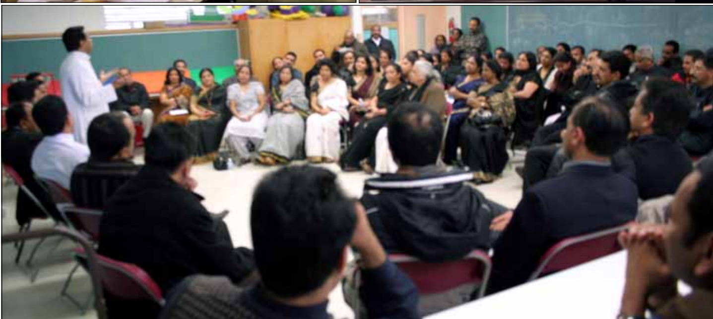
Summer program planning at Sacred Heart Knanaya Catholic Church