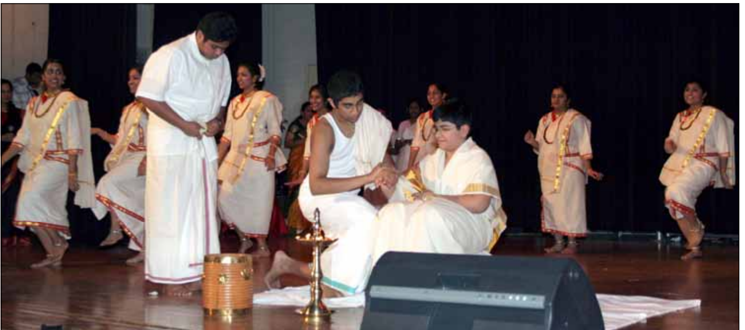
Scenes from Knanaya Wedding Ballet: Mailanji and Chantham Charth.