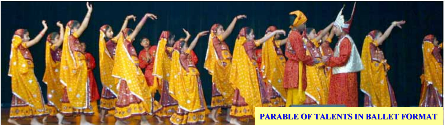
PARABLE OF TALENTS IN BALLET FORMAT

REVISED SKETCH OF THE PROPOSED YOUTH CENTER AT OUR SACRED HEART CHURCH