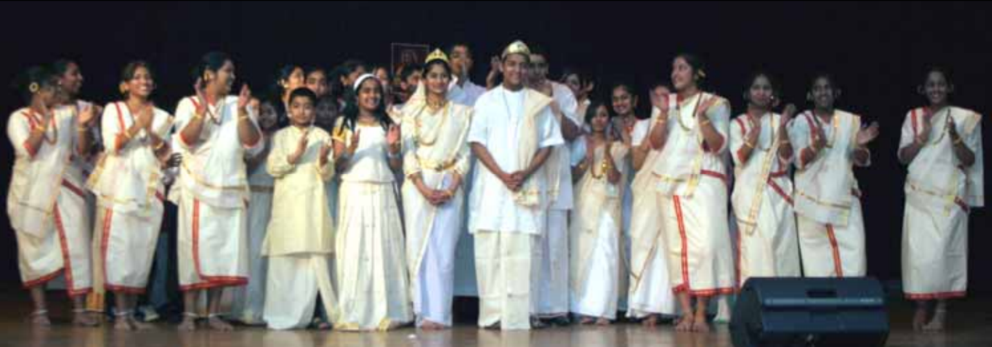
A scene from the Knanaya Wedding Ballet presented during the Religious Education Festival.