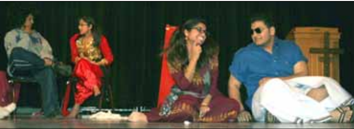
Skit with a message by the Religious Education Staff.

ജീവകാരുണ്യ പ്രവർത്തനങ്ങൾക്ക് പ്രാധാന്യം നൽകിക്കൊണ്ട് നവംബർ 19ന് നടത്തിയ ക്യാൻഫറഡ് ഡ്രൈവിലൂടെ ഉപയോഗ യോഗ്യമായ ധാരാളം ഭക്ഷണം ശേഖരിക്കുവാൻ സാധിച്ചു. നാട്ടിലുള്ള നിരീയനരായ കുട്ടികൾക്ക് സഹായം എത്തിക്കുന്ന തിരുവേണ്ടി ഡിസംബർ 17ന് നടത്തിയ ഡോളർ ഡ്രൈവിലൂടെ കുട്ടികൾക്ക് പങ്കുവെയ്ക്കലിന്റെ സന്ദേശം ലഭിച്ചു. റിലീജിയസ് എജുക്കേഷൻ ഫെസ്റ്റിവലിന് മുന്നോടിയായി രണ്ടുതവണ റീച്ചേഴ്സ് ഒത്തുചേരുകയും പരിപാടി വിജയിപ്പിക്കുന്നതിനായുള്ള ആശയങ്ങൾ പങ്കുവെക്കുകയും ചെയ്തു. കഴിഞ്ഞ ഒരു