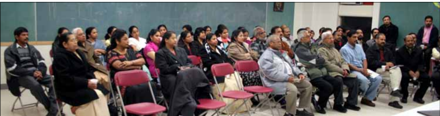
യൂത്ത് സെന്റർ പ്രോജക്ട് മെൻസ് മിനിസ്ട്രിയുടെയും വിമൻസ് മിനിസ്ട്രിയുടെയും പ്രതിനിധികൾ ചർച്ച ചെയ്തപ്പോൾ