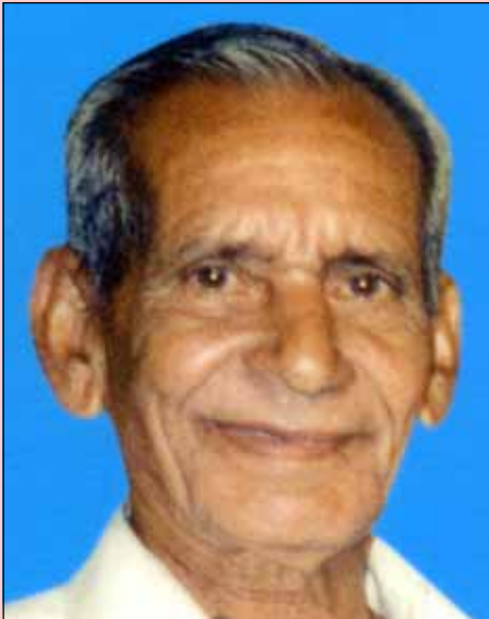
ഇട്ടിക്കുഞ്ഞു കോര ചാത്തംപടം, ഓണംതൂരത്ത്