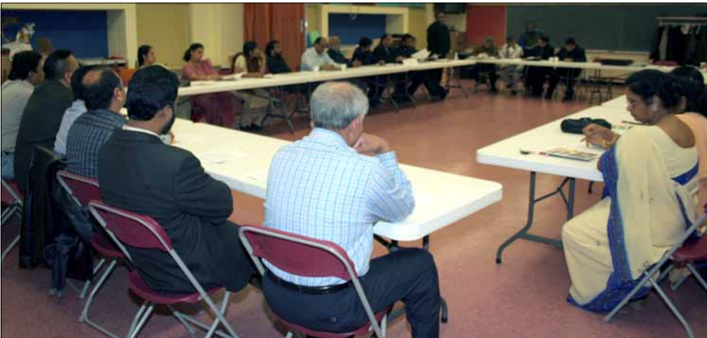
കേരള സഭകളുടെ എക്യുമെനിക്കൽ സമ്മേളനം നമ്മുടെ പാരിഷ് ഹാളിൽ ചേർന്നപ്പോൾ.