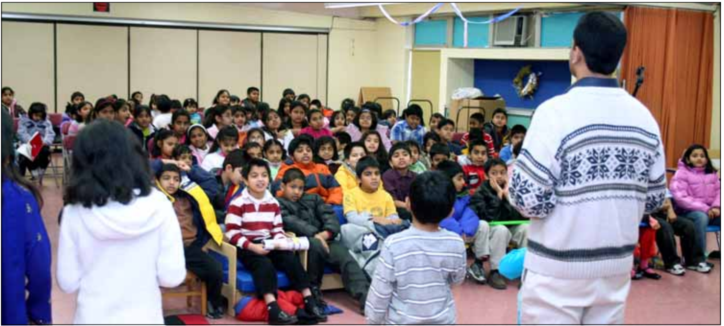
CHILDREN MINISTRY PROGRAM HELD AT SACRED HEART CHURCH

Please support our advertisers who make this bulletin available for us.