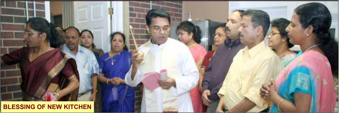
BLESSING OF NEW KITCHEN