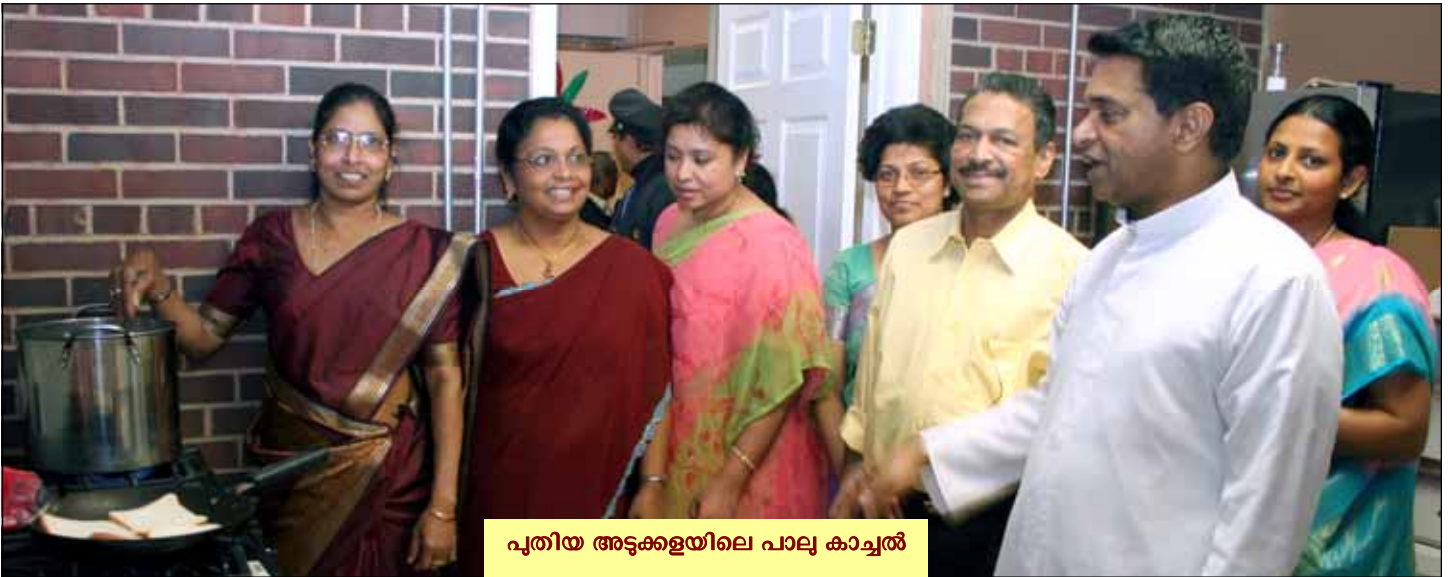
പുതിയ അടുക്കളയിലെ പാലു കാച്ചൽ