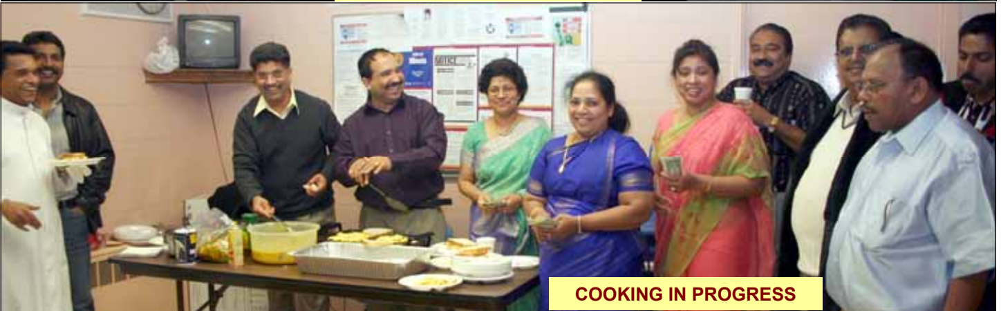
COOKING IN PROGRESS