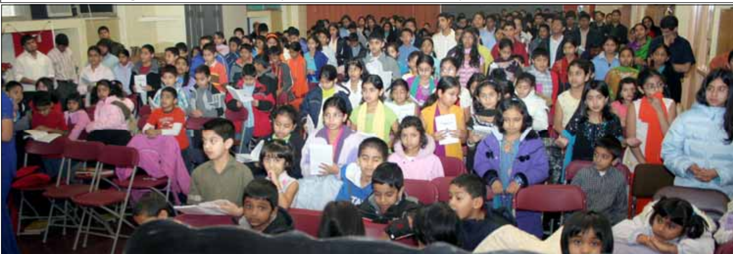
Syro-Malabar English Mass held at Sacred Heart Church for children and youth.

RETREAT IN OUR PARISH BY LEADERS OF SHALOM TV & SHALOM PUBLICATIONS AS A PART OF THE SOLEM FEAST OF LITTLE FLOWER SAINT THERESA