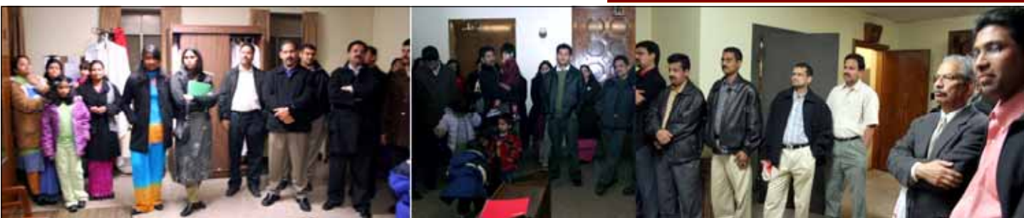
Planning session of First Holy Communion for St. Mary's Unit held at OLV Church.