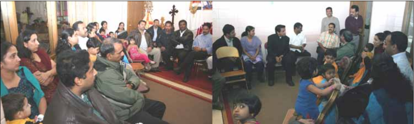
Planning session of the First Holy Communion at Sacred Heart Church.