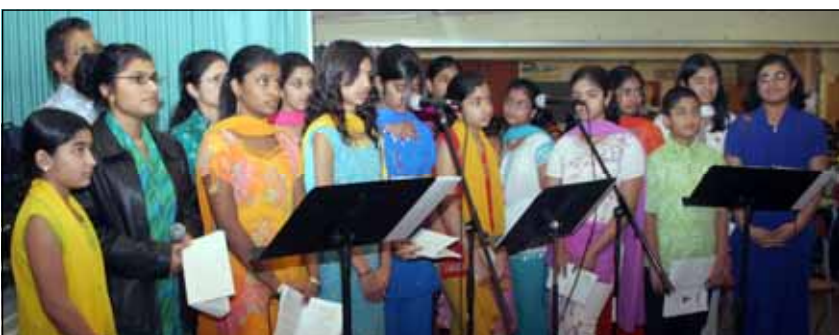
Children choir at Sacred Heart Church.