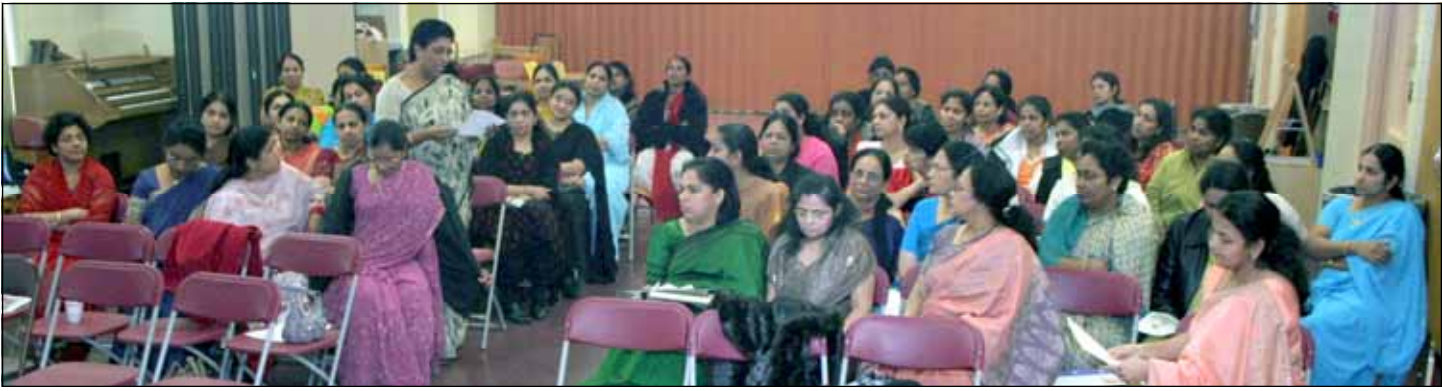
വിമൻസ് മിൻസിയുടെ ആഭിമുഖ്യത്തിൽ സെമിനാറും പുതുവത്സരാഘോഷവും നടത്തിയപ്പോൾ.

(Admission by Pass Only) Layout & Design: Able Design (713-436-0939)