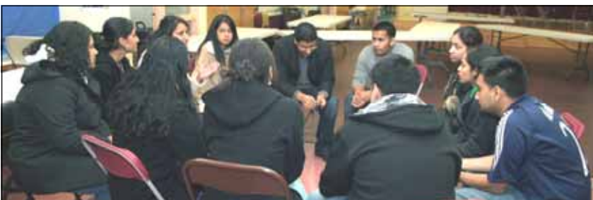
Planning of prayer groups by the young adult ministry of Sacred Heart Knanaya Catholic Parish.

Sacred Heart Knanaya Catholic Church, 611 Maple St., Maywood, IL 60153 St. Mary's Parish Unit, 5212 W. Agatite Ave, Chicago, IL 60630 January 28, 2007, Vol. 2, Issue 18 www.knanayaregion.us/chicago/bulletin.htm