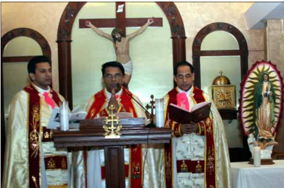
PHOTO FEATURE OF THE FEAST OF OUR LADY OF GUADALUPE