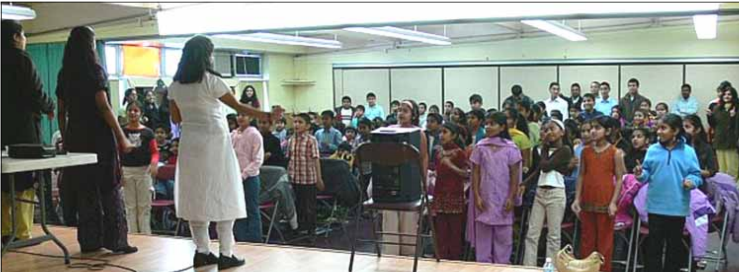
CHILDREN AND TEENS MINISTRY PROGRAMS HELD AT SACRED HEART CHURCH BY JESUS YOUTH TEAM

നമ്മുടെ സമുദായം അമേരിക്കയിൽ നിലനില്ക്കുന്നത് നമുക്കുറപ്പുതരേണ്ടത് നമ്മുടെ വരും തലമുറയാണ്. നാട്ടിലെപ്പോലെ അവരെ നമുക്ക് മതബോധന സൂത്രീലൂടെയും ഭക്ത സംഘടനകളിലൂടെയും വിശ്വാസികളും സമുദായ സ്നേഹികളുമാക്കാം. അതിനു മുടക്കുന്ന പണവും അദ്ധ്യാനവും സമയവും നമ്മെ എന്നും സംതൃപ്തരാക്കും.