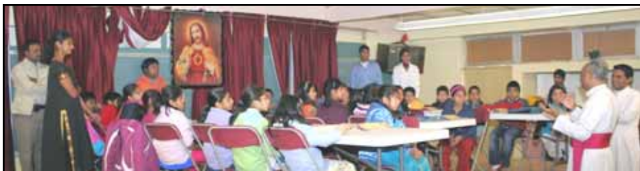
PHOTOS OF PASTORAL VISIT TO RELIGIOUS EDUCATION CLASSROOMS BY MAR JACOB ANGADIATH DURING HIS VISIT TO THE PARISH ON OCTOBER 29, 2006