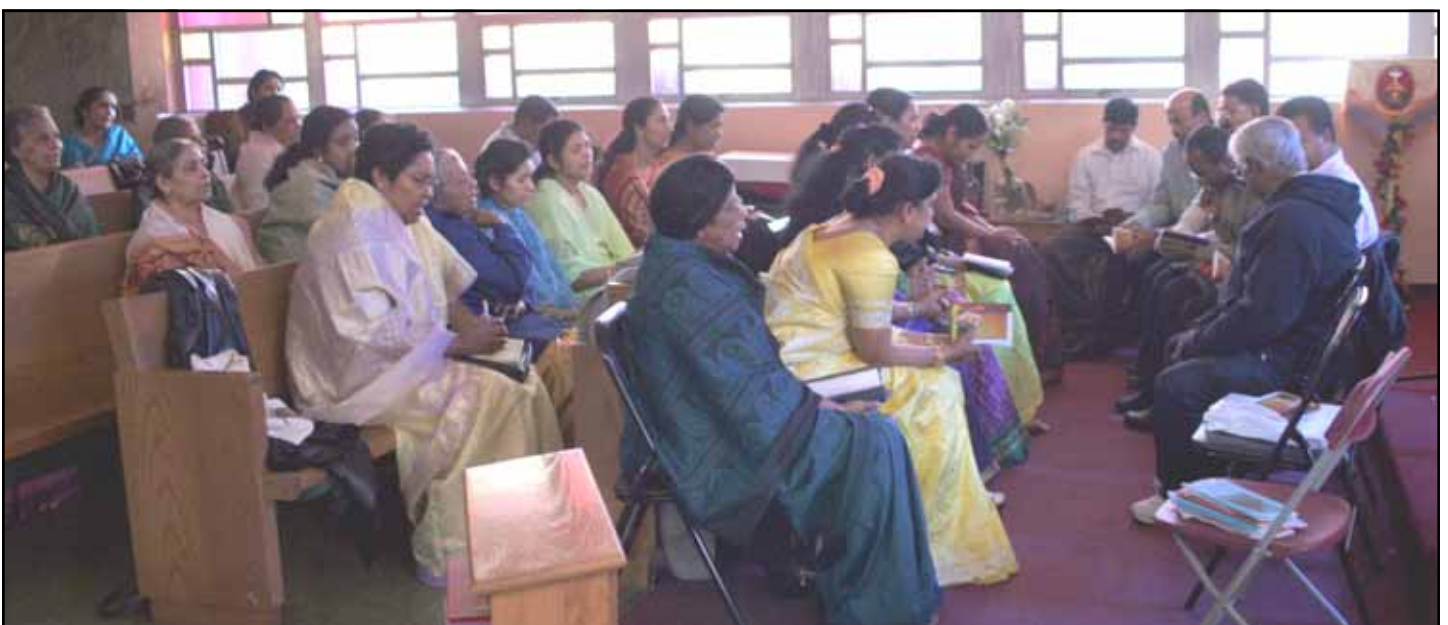
SACRED HEART PRAYER GROUP MEETS EVERY SUNDAY AFTER HOLY MASS AT OUR CHURCH