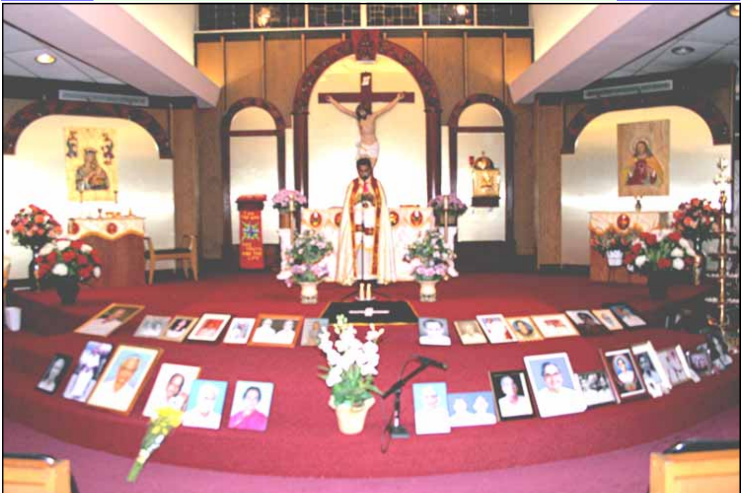
REMEMBERING OUR ANCESTORS BY SPECIAL PRAYER SERVICE ON NOVEMBER 2ND.