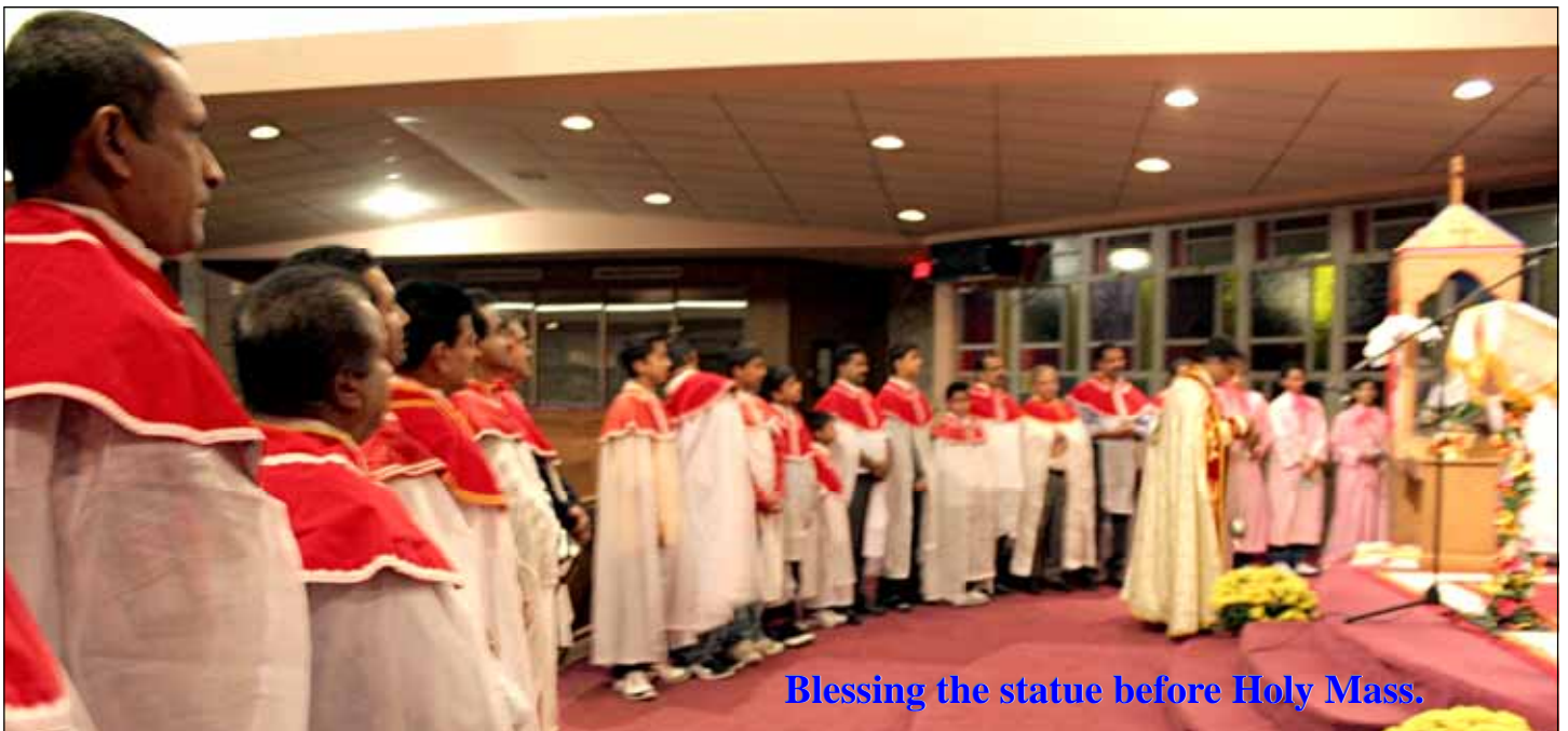
Blessing the statue before Holy Mass.