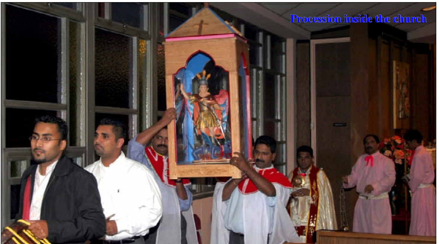
Procession inside the church